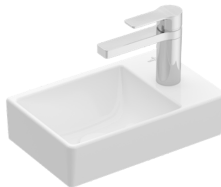
Umývatko Avento VILLEROY & BOCH

Značky GROHE a VILLEROY & BOCH patří mezi přední světové výrobce prémiového koupelnového vybavení. Spojují moderní design, vysokou kvalitu zpracování a dlouhou životnost s důrazem na funkčnost, komfort a hygienu. Jejich produkty splňují i ty nejnáročnější požadavky na každodenní používání a nadčasový vzhled koupelny.