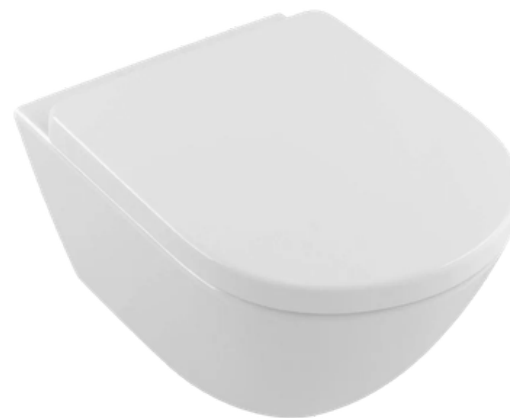
Závěsné WC 2.0 VILLEROY & BOCH SUBWAY s externím odsáváním zápachu

Závěsné WC Villeroy & Boch Subway 2.0 vyniká čistým, nadčasovým designem a precizním zpracováním. Nabízí vysoký uživatelský komfort, snadnou údržbu a efektivní splachování. Součástí řešení je také externí odsávání zápachu, které zvyšuje hygienický standard a pohodlí při používání. Elegantní řešení, které se přirozeně začleňuje do moderní koupelny.