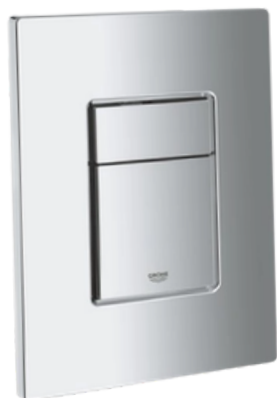
Ovládací tlačítko GROHE SKATE COSMOPOLITAN