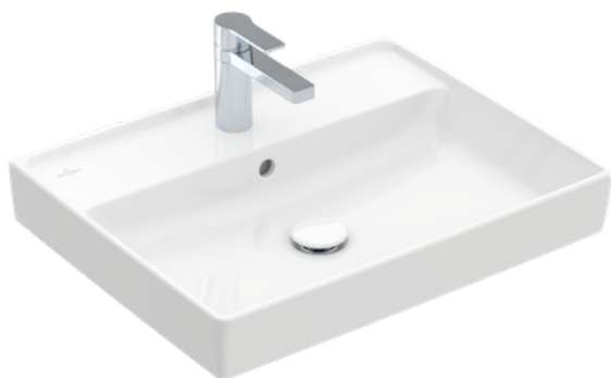
Umyvadlo Collaro VILLEROY & BOCH