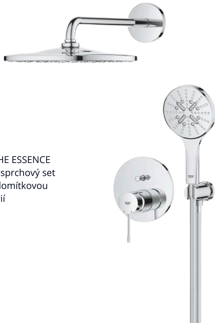
GROHE ESSENCE NEW sprchový set s podomítkovou baterií