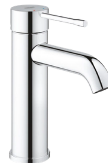
Baterie umyvadlová Grohe Essence New